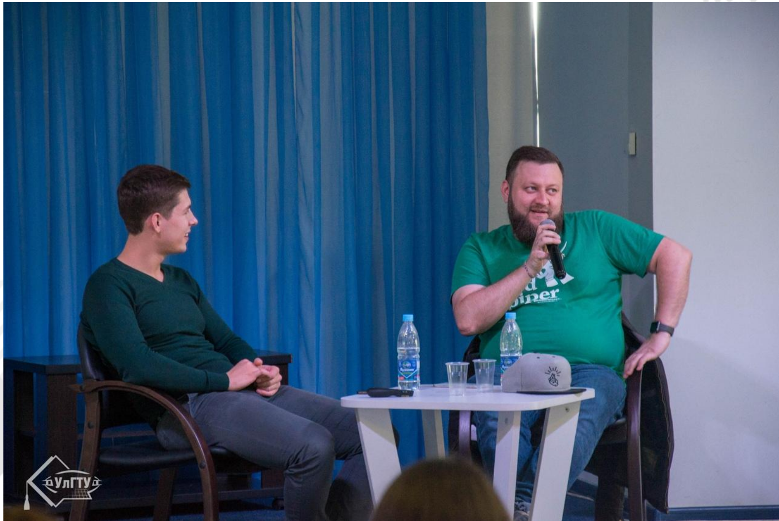
Мероприятие «Наших видно издалека!»